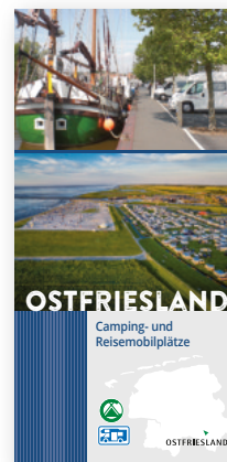
Ostfriesland – Camping- und Reisemobilplätze (gültig seit August 2018) 50.000