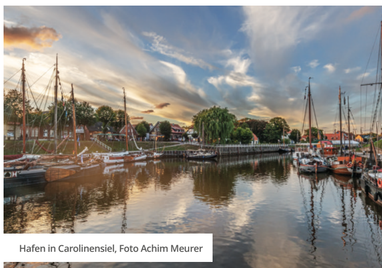
Hafen in Carolinensiel

Um das Profil der Reiseregion Ostfrieslands zu schärfen, war das Fotografenpaar „Die Meurers“ ( www.meurers.net ) vom 5. bis 19. August 2018 im Auftrag der OTG in der Region unterwegs. Von typischen Motiven, die ganz klar auf die Kernthemen Ostfrieslands einzahlen, nahmen sie neue und ungewöhnliche Perspektiven auf. Sei es in Newslettern, auf Messen oder in Katalogen – das neue Bildmaterial wirkt in ganz besonderem Maße identitätsstiftend für Ostfriesland.