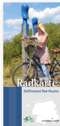
Radkarte – Ostfriesland Radrouten (gültig seit Dezember 2017) 80.000