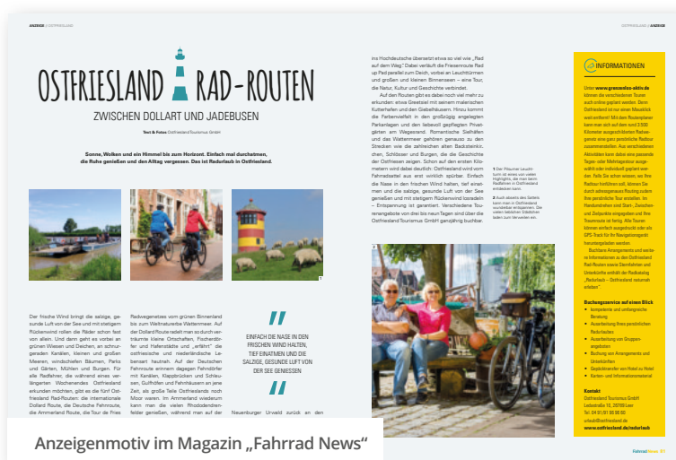
Anzeigenmotiv im Magazin „Fahrrad News“

Eine zusätzliche Verteilung erfolgte über Beilegeraktionen in der MyBike (10.000 Radkataloge), der Bike & Travel und der Fahrrad News (30.000 Radkarten) und dem Leserkreis Daheim (10.000 Reiseführer in Cafés und Arztpraxen).