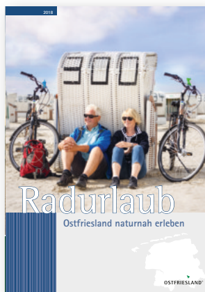
Radurlaub – Ostfriesland naturnah erleben (Gültigkeit 2018) 60.000