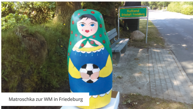
Matroschka zur WM in Friedeburg

Der Sommer 2018 stand ganz im Zeichen der Fußball-Weltmeisterschaft in Russland. Anlässlich des Gastgeberlandes machte das ARD-Morgenmagazin die Ortschaft Rußland in der Gemeinde Friedeburg zum Schauplatz des Formats. Die an 12 Sendetagen von jeweils 5:30 bis 9:00 Uhr ausgestrahlten Live-Sendungen mit bekannten Moderatoren und prominenten Gästen generierten eine durchschnittliche Einschaltquote von 5,63 Millionen Zuschauern pro Sendetag. Die OTG begleitete in Zusammenarbeit mit der Friedeburger Tourist-Information