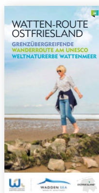
Wanderkarte – Watten-Route (gültig seit November 2017) 30.000