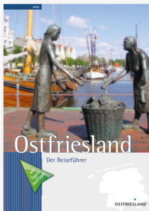
Ostfriesland – Der Reiseführer (Gültigkeit 2018) 60.000

Neben der jährlichen Neuauflage der Klassiker in der Prospektfamilie der OTG, dem Reiseführer und dem Radkatalog, ist 2018 erstmals der Faltplan „Ostfriesland – Barrierefreie Reiseregion“ erschienen. Die Campingkarte wurde im Sommer mit einer voraussichtlichen Laufzeit von zwei Jahren neu aufgelegt. Der Vertrieb erfolgt direkt über den Prospektversand sowie durch Auslage auf Messen, Coupon-Anzeigen, Beilagen und Verteilung über unsere Partner.