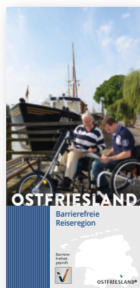
Ostfriesland – Barrierefreie Reiseregion (gültig seit Oktober 2018) 60.000