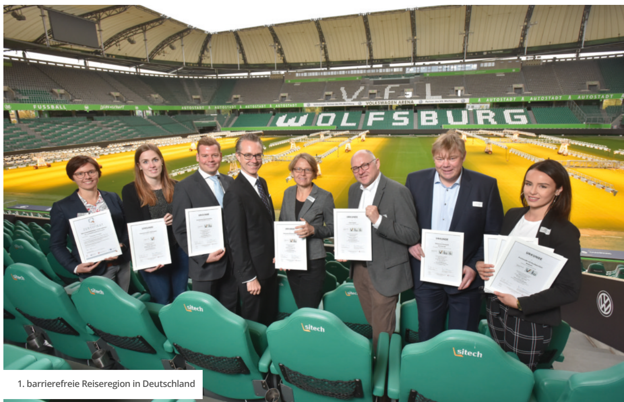
1. barrierefreie Reiseregion in Deutschland

Gut vorangeschritten ist auch die Umsetzung des bundesweiten Erhebungs- und Zertifizierungsprojekts „Reisen für Alle“ in Kooperation mit der TMN. Neben den zertifizierten Angeboten der Ferienorte aus der Regionszertifizierung sind darüber hinaus weitere 120 Anbieter auf der ostfriesischen Halbinsel zertifiziert bzw. befinden sich im Erhebungsprozess. Erste Rezertifizierungen wurden durchgeführt.