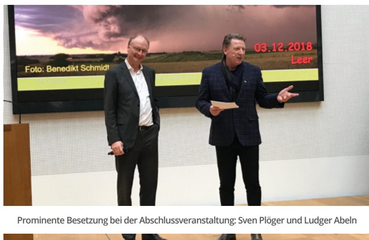
Prominente Besetzung bei der Abschlussveranstaltung: Sven Plöger und Ludger Abeln

Zum Projektabschluss organisierten die OTG und die Nationalparkverwaltung das 9. Welterbemarforum, das gleichzeitig Abschlussveranstaltung des INTERREG V A-Projektes war. Rund 200 deutsche und niederländische Teilnehmer informierten sich über die Projektergebnisse, folgten einer hochkarätig besetzten Podiumsdiskussion und lauschten Sven Plögers Vortrag zum Klimawandel. Im Rahmen der Abschlussveranstaltung überreichte Frau Honé, Ministerin für Bundes- und Europaangelegenheiten, den Projektpartnern den Bewilligungsbescheid für die Watten-Agenda 2.0.