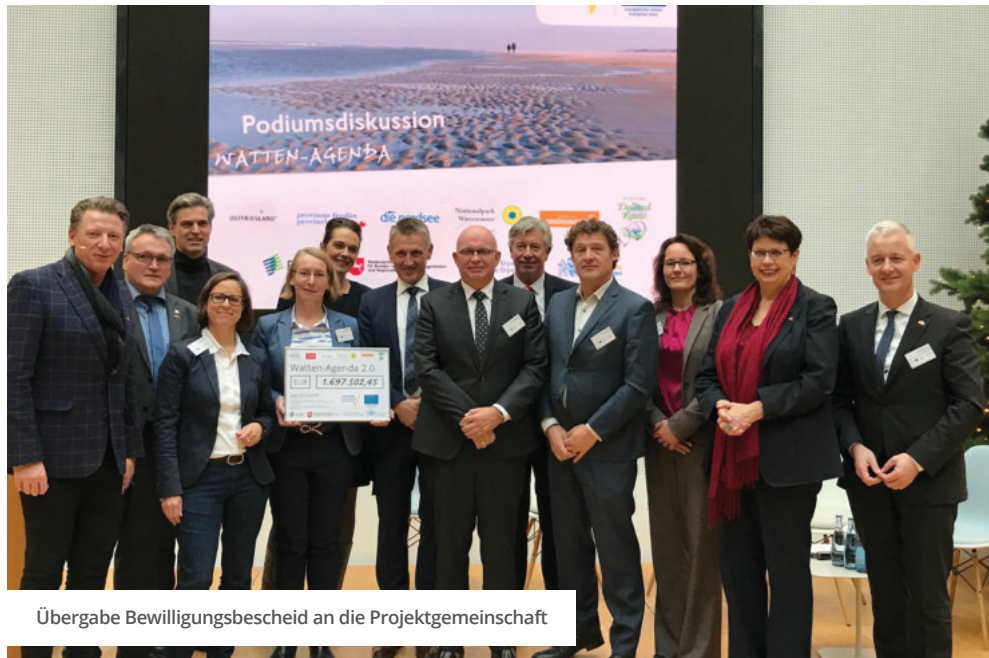
Übergabe Bewilligungsbescheid an die Projektgemeinschaft

Das grenzübergreifende INTERREG V A-Projekt „Watten-Agenda“ ging 2018 in das finale Umsetzungsjahr. Zahlreiche Maßnahmen, von der Watten-Route, der Auflage von Kinderbüchern, der Einrichtung von Fahrradzahlstationen an der Dollard Route bis hin zu Infotafeln für Wanderer, tragen nunmehr zur Entwicklung eines nachhaltigeren und wertschätzenden Tourismus am Welterbemar Wattenmeer bei.