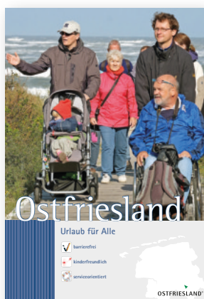
Ostfriesland – Urlaub für Alle (gültig seit Mai 2017) 20.000