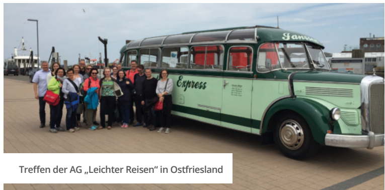
Treffen der AG „Leichter Reisen“ in Ostfriesland